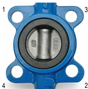
Figura 3 – Sequência de aperto dos parafusos do flange.