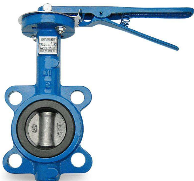
Figura 1 – Válvula Borboleta CL 150

MANUAL DE INSTALAÇÃO, MANUTENÇÃO E ARMAZENAGEM